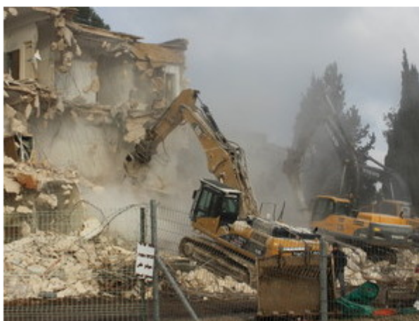
הריסת מלון שפרד

דחפורים וכלים כבדים החלו להגיע הבוקר (א) לשכונת שיח' ג'ראח שבמזרח ירושלים, בכונה להרוס את מלון שפרד השנוי במחלוקת, וכן, ככל הנראה, לקבוע מה תהיה זהותה של השכונה. כלי השטח הכבדים נועדו להחל בהריסה של המבנה ההיסטורי, ליישר את השטח ולהכין אותה לבניית שכונה יהודית במקום.