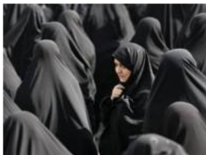
בשם האמונה

חוק המדינה האיסלאמית של פקיסטן גוזר עונש מוות על המחלל את שמו של הנביא, או של חבר מרעיו, או של האיסלאם - על הפרת החוק הורשעה אישה נוצריה המתגוררת בפקיסטן, והיא צפויה לעלות לגרדום - סלמן טייסיר ראש ממשלת חבל פונג'אב בפקיסטן הביע את התנגדותו לחוק, ובכך חרץ את גורלו שלו למוות