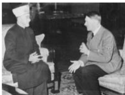
חאג' אמין אל חוסייני בפגישתו עם היטלר בברלין

עובדה זו התבררה במהלך הדיונים המשפטיים סביב העבודות בקרקע - ביהמ"ש המחוזי איפשר להמשיך בביצוע העבודות