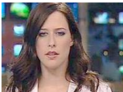
חדשות ערוץ 2

במקום חדשות הוגשה לצופים מרקחת מזוהה המפיצה שקרים גסים של האויב, סילופי האמת בענייני פנים ותעמולה בולשביקית של קנאה, צרות עין ותמיכה בקבוצות המזיקות לעניין הלאומי, אם במזיד כמו בבילעין ואם בחוסר אחריות כמו עובדי משרד החוץ